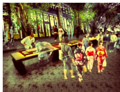
「大手町縁日2016」イメージ