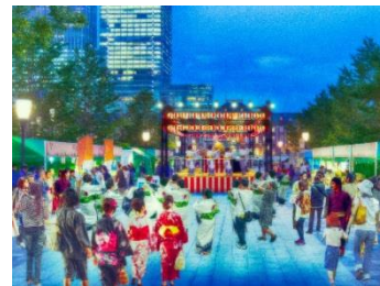
「東京丸の内盆踊り2016」イメージ