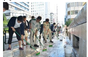
過去開催時の様子

日 時 : 8月5日(金) 16:00~17:00 場 所 : 鎌倉橋 主 催 : 鎌倉橋橋洗いプロジェクト実行委員会