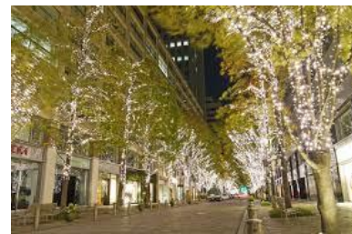
国家戦略特区に指定された丸の内仲通りの様子