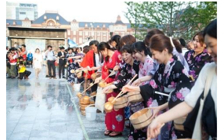
過去開催時の様子