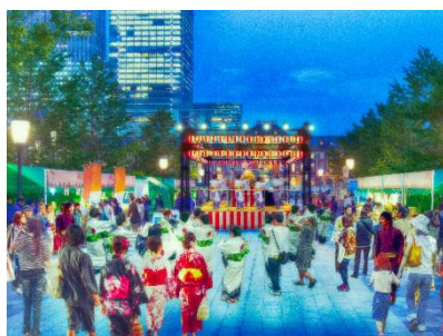
「東京丸の内盆踊り2016」イメージ

丸の内では、本イベントを通じて大丸有エリアを訪れた方々や就業者の皆さまに、夏の涼を肌で体感していただくとともに、楽しみながら環境保全の取り組みについて意識していただける機会を創出します。